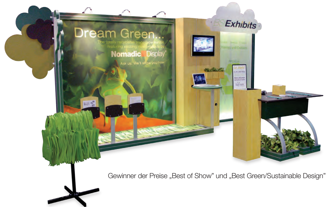
Gewinner der Preise „Best of Show“ und „Best Green/Sustainable Design“